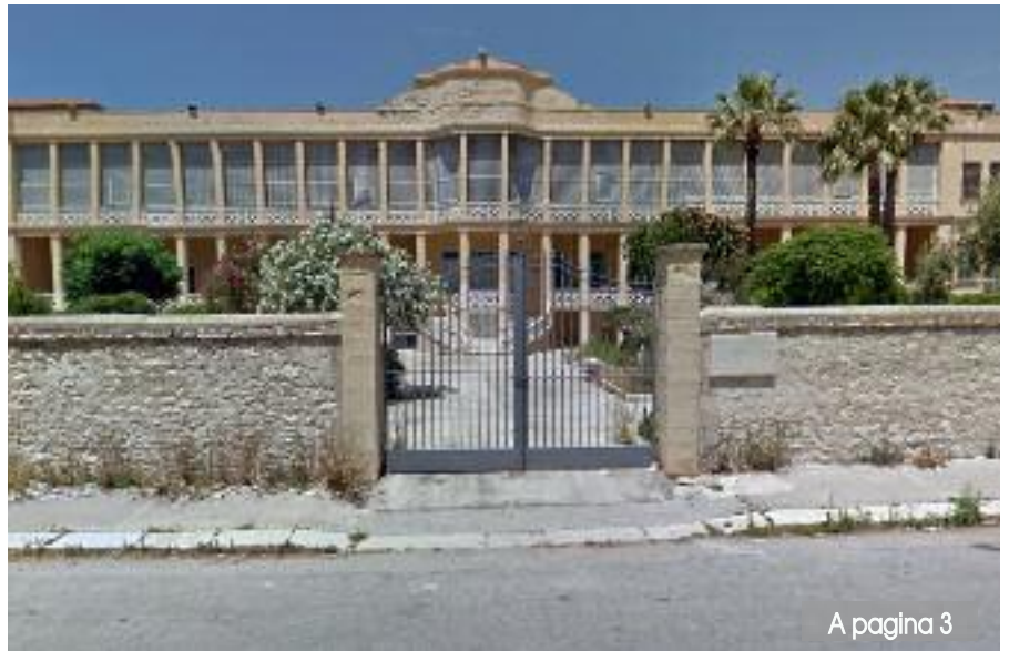
A pagina 3