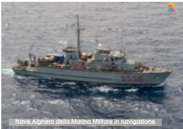
Nave Alghero della Marina Militare in navigazione

Le operazioni si svolgono in prossimità della rotta di atterraggio al porto di Trapani, ricadente all'interno della poligonale ottenuta congiungendo quattro punti geografici dei quali l'ordinanza della capitaneria elenca con preci-